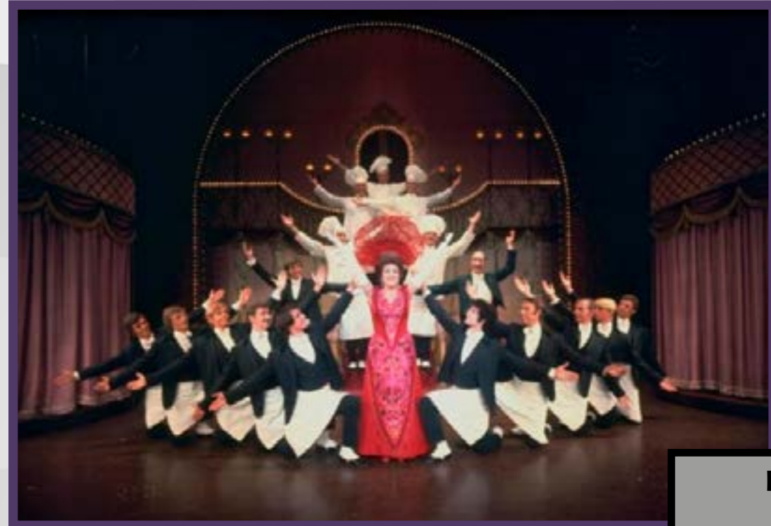
Dolly Hello Dolly! , 1970

Echemos un vistazo a algunos de los personajes más memorables e icónicos de Ethel Merman.