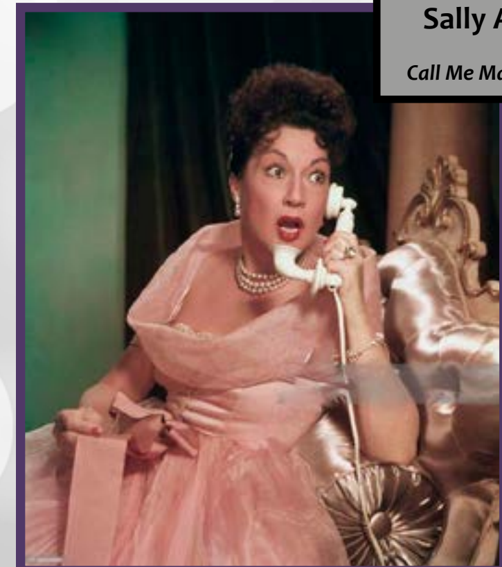
Sally Adams Call Me Madam , 1950