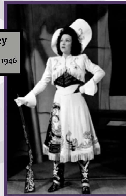
Annie Oakley Annie Get Your Gun , 1946